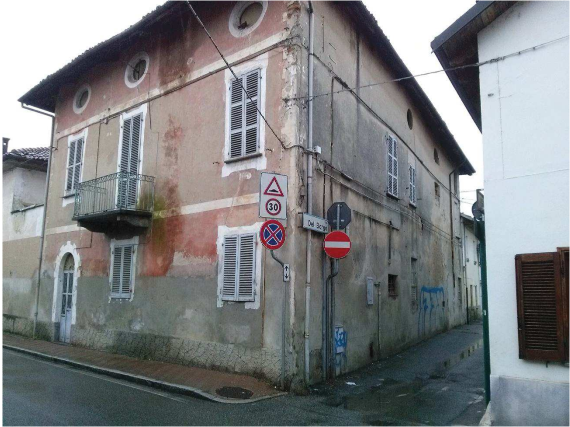
PROSPETTO NORD su Via del Borgo sc. 1:100